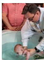
Baptême par immersion.