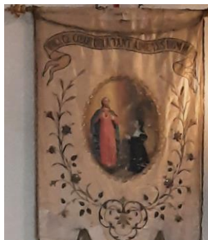
L'église de Chuyer a quelques trésors représentatifs du Sacré-Cœur de Jésus (sculpture, tapisseries, vitrail).

..... A la suite de la messe célébrée à Chuyer le 11 juin à l'occasion de la Fête du Sacré-Cœur de Jésus, le groupe Louange de la paroisse nous a proposé un temps d'action de grâce d'une trentaine de minutes. De nombreux chants nous ont permis de louer Dieu de tout notre cœur. Prochaine soirée Louange à la rentrée.