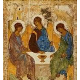
En juin, l'icône de la Trinité peinte par le russe Andrei Roublev a accompagné nos messes.

On peut aussi expliquer la Trinité aux enfants en leur montrant une image du soleil et en leur posant la question : que nous donne le soleil ? (sa lumière, sa chaleur, ses rayons). On peut donc dire que le soleil nous envoie ses rayons, que le soleil nous envoie sa chaleur, que le soleil nous envoie sa lumière et pourtant, c'est une seule et même chose : le soleil. Avec la Trinité, c'est le mystère de Dieu révélé en trois personnes.