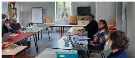
Réunion à la maison paroissiale le 12 octobre pour le déploiement du logiciel