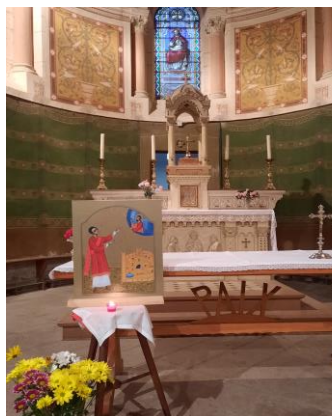
Messe le 6 octobre à Lupé